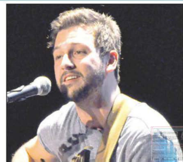
Tremblay a fait découvrir au public des textes sensibles sur des rythmes entraînants.