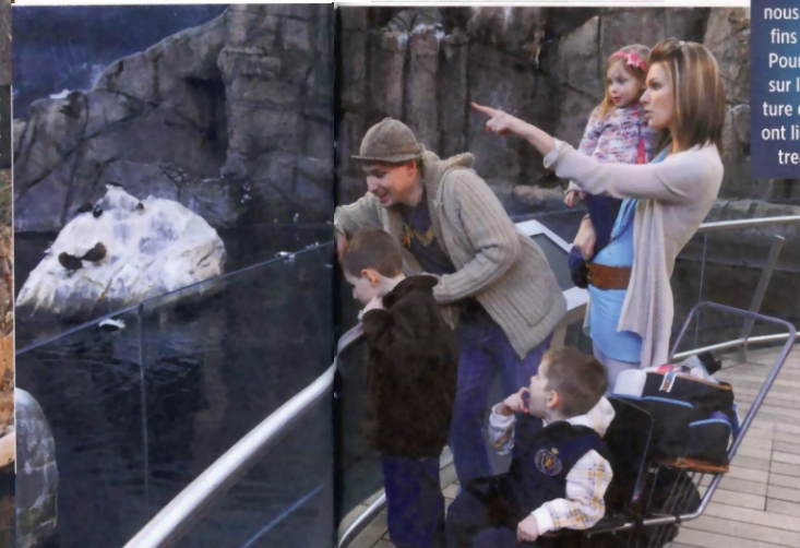
... et ils ont pu se croire, pendant quelques instants, en plein golfe du Saint-Laurent.